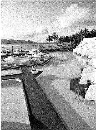
撮影地 ハミルトン島(オーストラリア)