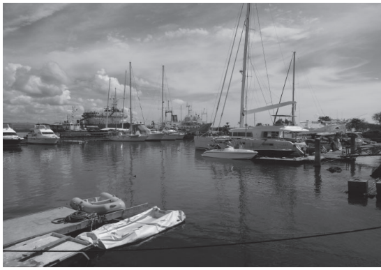
撮影地 セブ島